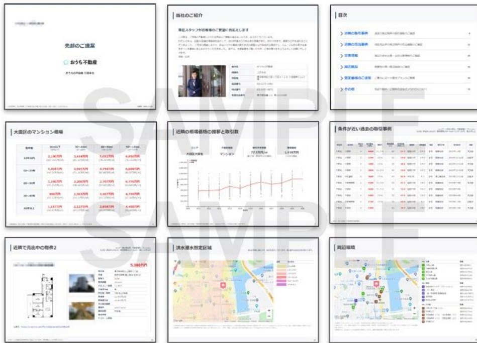
オウチーノくらすマッチ「不動産査定」